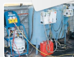
フロン回収機と油抜き取り機